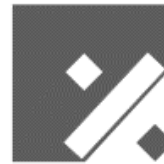
TAX & CORPORATE