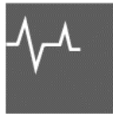
AUDIT & ADVISORY